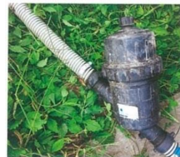
サニーホースとろ過器(ディスクフィルター)